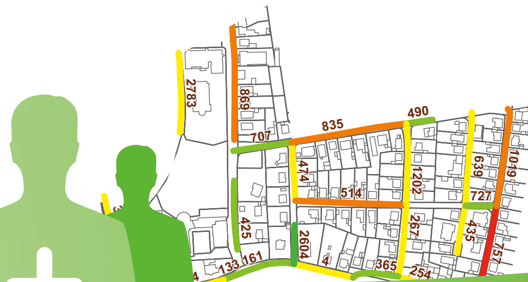
Ergebnisdarstellung Beispiel Wärmelinienkarte